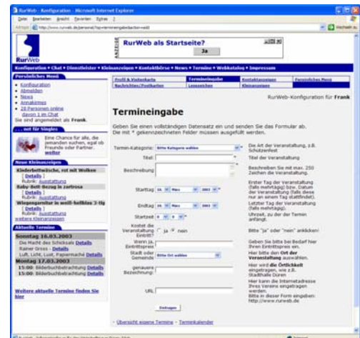
Termineingabe in der persönlichen Konfiguration

Der normale, kostenlose RurWeb-Account wird um zwei Funktionen erweitert: